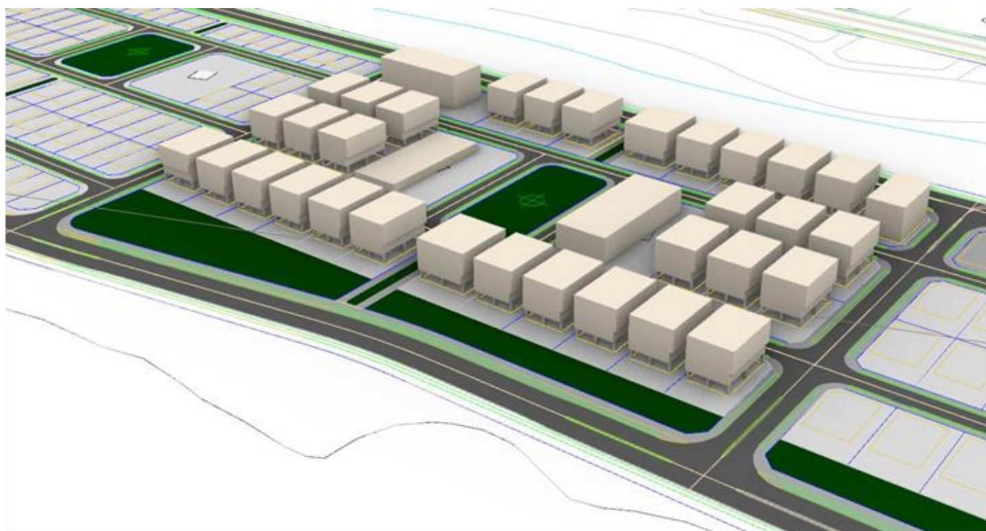
تصاویر سه بعدی مجموعه مسکونی تیاب ۲