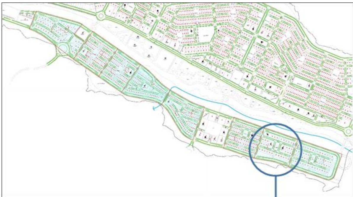
نقشه سایت پلان مجموعه مسکونی تیاب دو