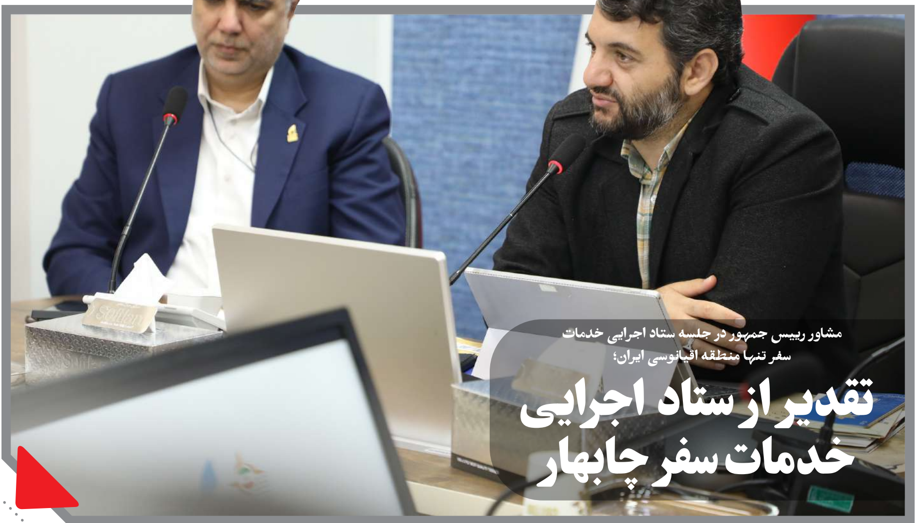
مشاور رییس جمهور در جلسه ستاد اجرایی خدمات سفر تنها منطقه اقیانوسی ایران؛