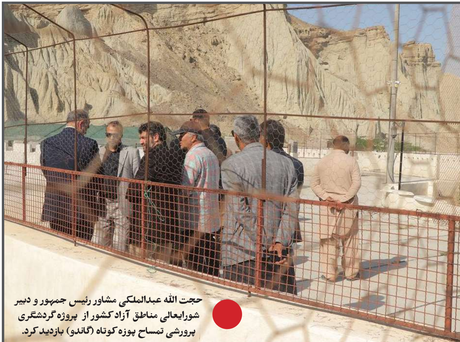
حجت الله عبدالملکی مشاور رئیس جمهور و دبیر شورایی عالی مناطق آزاد کشور از پروژه گردشگری پرورشی تمساح پوزه کوتاه (گاندو) بازدید کرد.

مدیرعامل سازمان منطقه آزاد چابهار در پایان خاطر نشان کرد: تمامی تلاش‌های ما در عمل به مسئولیت‌های اجتماعی باهدف ارائه خدمات شایسته به مردم چابهار، سرمایه‌گذاران و گردشگرانی است که با حضور در این منطقه به رونق اقتصاد و توسعه و آبادانی این منطقه کمک می‌کنند.